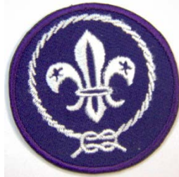
Insignia Flor de Lis Mundial

La noche anterior a la ceremonia de la Promesa se hará la “Velada de Promesa”, en la que te reunirás con tu Avanzada para reflexionar sobre distintos temas que la Avanzada te va a plantear. A continuación tendrás un momento de intimidad y reflexión personal. En la Ceremonia de Promesa se te hará entrega de la insignia de la Flor de Lis Mundial, que te colocarás en la manga derecha del uniforme, pudiendo llevar también otra insignia en el pico de tu pañoleta que te recuerde en el día a día tu compromiso con el escultismo.